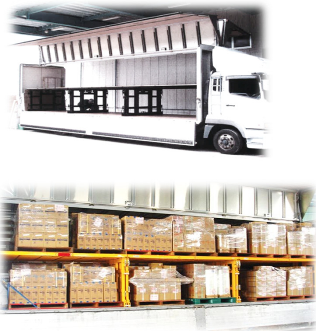
【標準サイズトラック用】