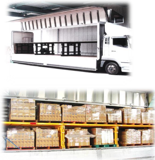
【標準サイズトラック用】